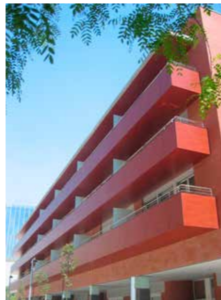
Wooncomplex | Barcelona | Spanje

Als specialist in gevelbekleding kan Trespa u helpen de juiste ontwerpkeuzes te maken.