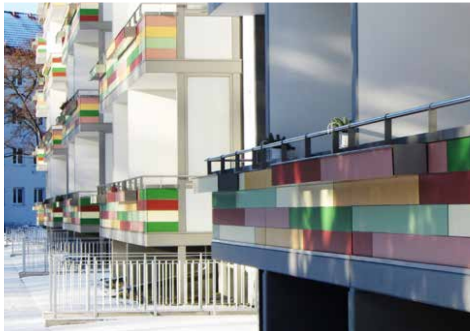
Wooncomplex | Dresden | Duitsland

Alle producten van Trespa worden onder extreme omstandigheden getest. Een ervan is blootstelling van de platen aan een klimaat (zon, regen en luchtvochtigheid) dat gelijk is aan het klimaat in Florida. Trespa biedt een begrensde garantie van 10 jaar op het product. Neem contact op met uw lokale vertegenwoordiger voor meer informatie.