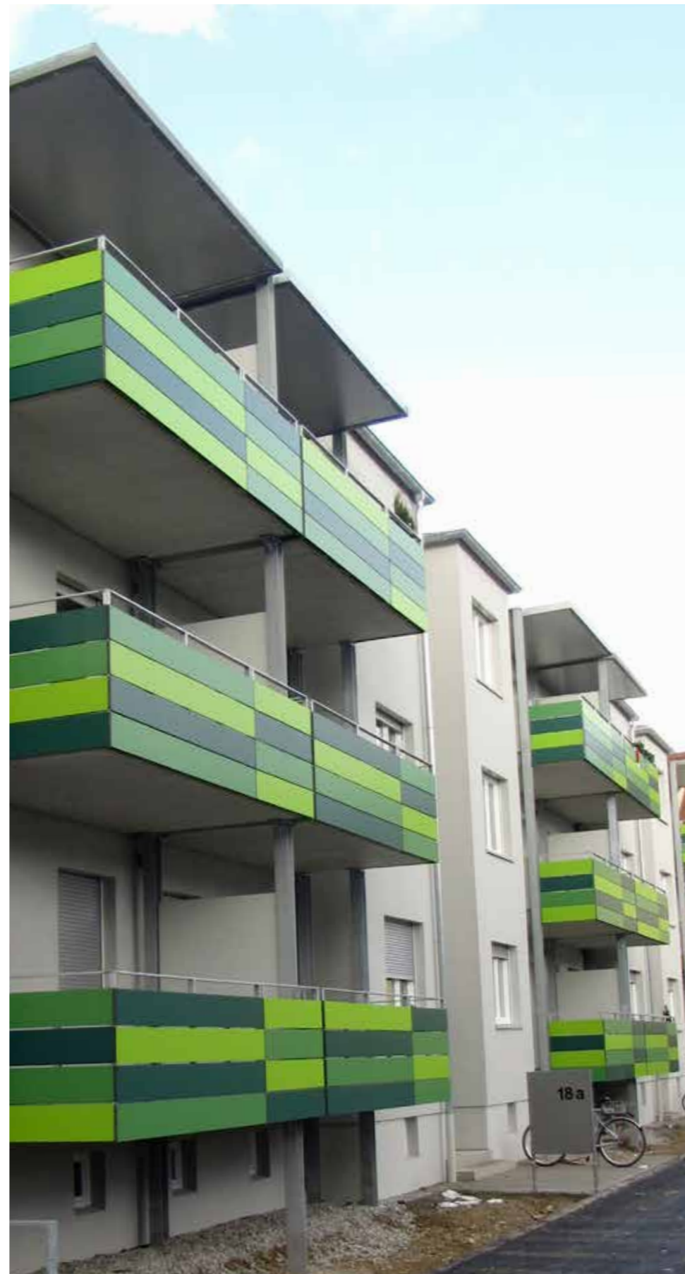
Angerhof | Augsburg | Duitsland

“In aanvulling op hun hoogwaardige esthetiek zijn Trespa® Meteon®-platen zeer duurzaam en presteren ze bijzonder goed in de buitenlucht. Trespa® Meteon® ziet er jarenlang mooi uit en draagt bij aan mooie, duurzame balkons.”