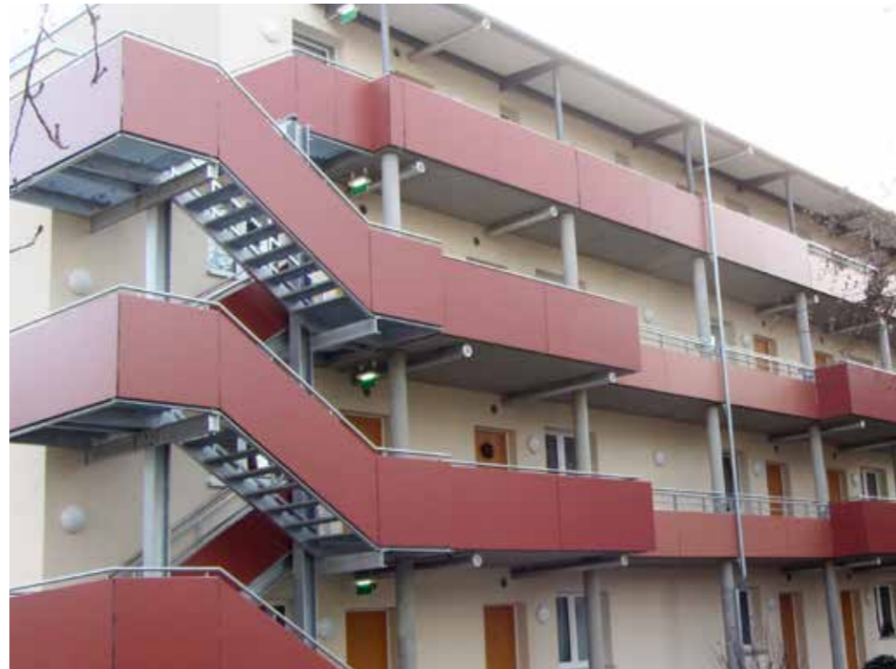
wooncomplex | Murcia | Spanje

Trespa® Meteon® heeft een goede slag- en stootvastheid en is prima bestand tegen slijtage door dagelijks gebruik.