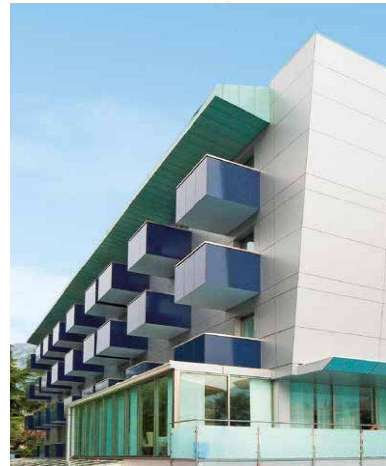
Hotel Caravel | Torbole | Italië