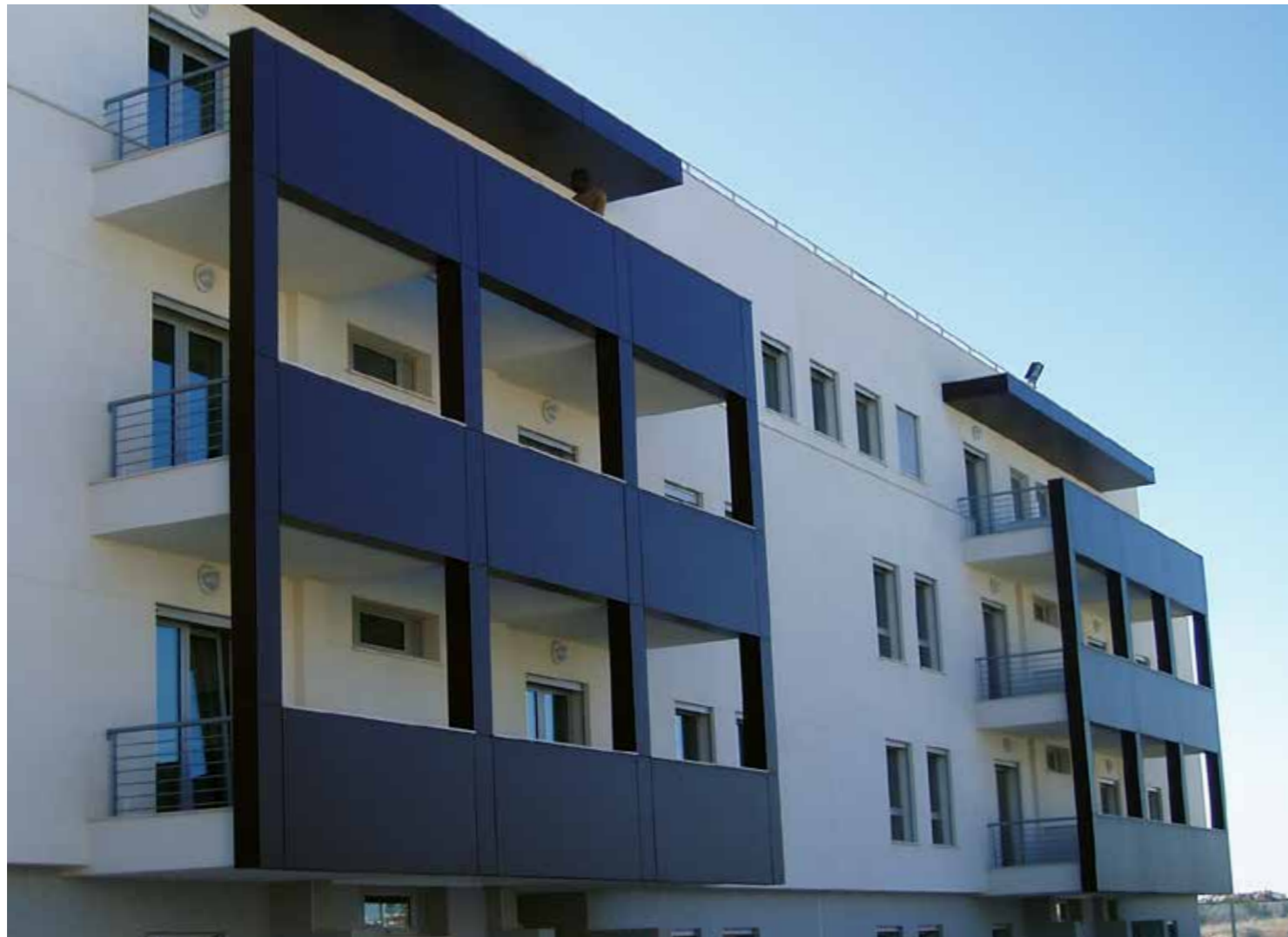
Wooncomplex | Lissabon | Portugal

Trespa® Meteon®-producten bevatten tot 70% natuurlijke vezels. Het volledige productassortiment van Trespa® Meteon® is nu op verzoek in beperkte hoeveelheden en binnen bepaalde rechtsgebieden met PEFC™ of FSC™ certificering leverbaar.